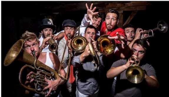
LE TROTTOIR D'EN FACE